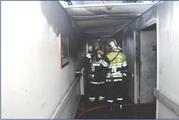
FEU DE BATIMENT PENNES MIRABEAU 9/02/2011