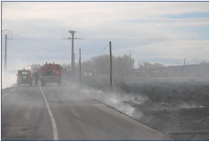
FEU DE CANIERS MARNANE 24/02/2011