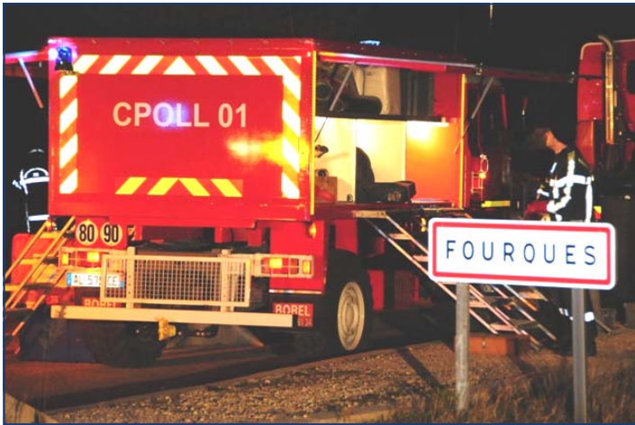
FUITE DE FUEL GARD 1/02/2011