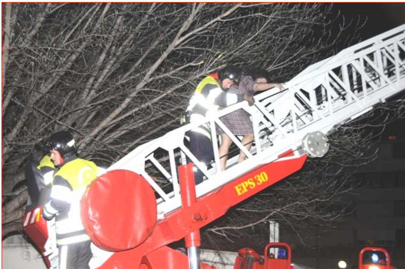
FEU D'APPARTEMENT : AIX-EN-PROVENCE