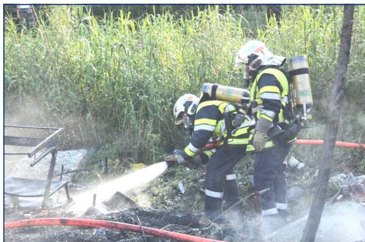
FEU DE CARAVANES AIX-EN-PCE 10/05/2011