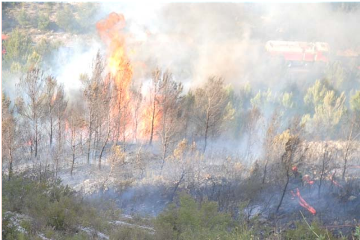
FEU DE FORET : LE ROVE