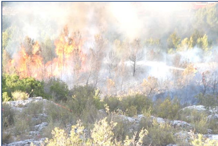
FEU DE FORÊT LE ROVE 25/05/11