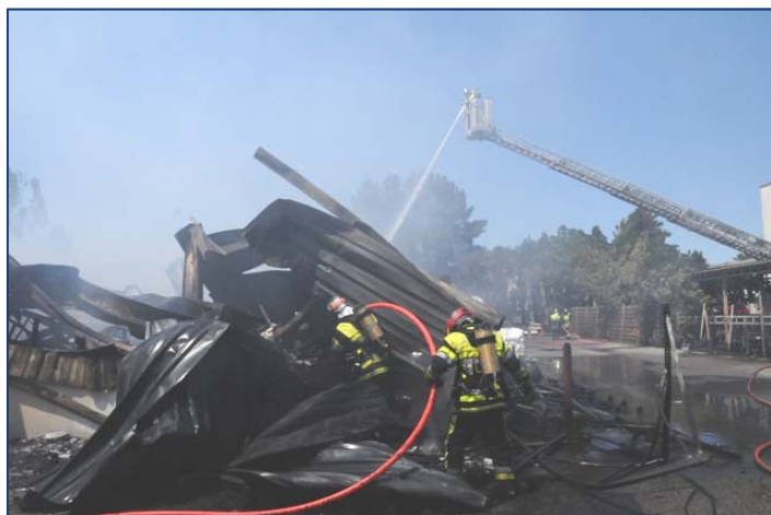
FEU D'ENTREPOT AIX-LES-MILLES 16/05/2011