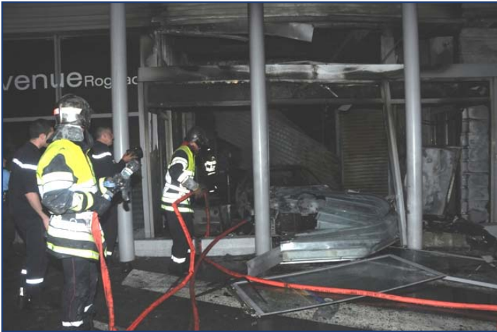
FEU DE SUPERMARCHE ROGNAC 23/05/2011